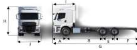
2533 &amp; 2633 HR